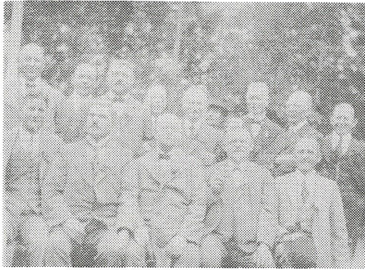
Udsnit af foreningens medlemmerne - omkring år 1920