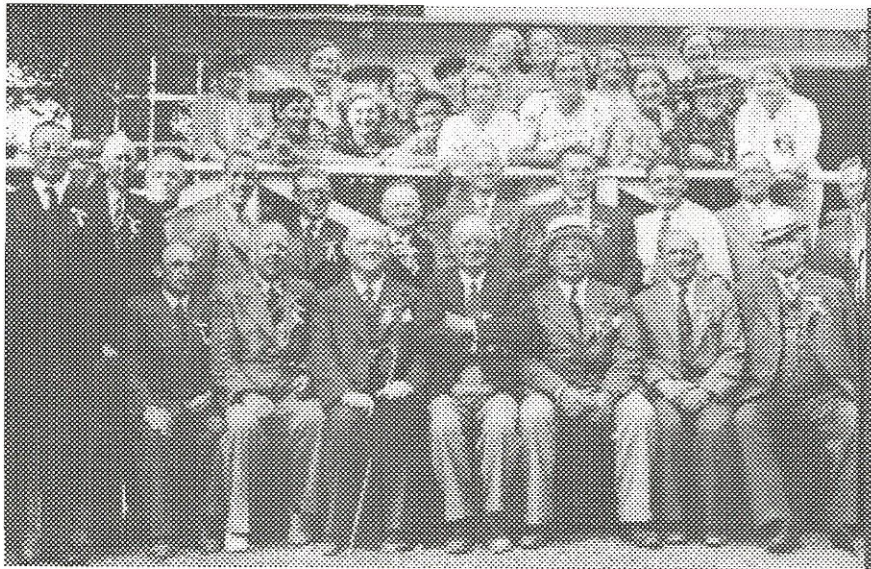
Medlemmer med damer. Året er ca. 1945.