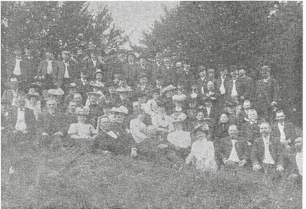
Generalforsamling i Horsens 1906